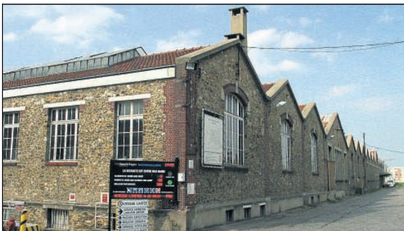
NANTERRE. Selon la direction du groupe Smurfit Kappa, propriétaire de la papeterie, l'outil de travail est arrivé à bout de souffle.

Le directeur général de la division papier de Smurfit Kappa, qui possède cette entreprise, a signifié le refus de son groupe d'investir dans la modernisation de l'outil de travail, qu'il considère quasi à bout de souffle. »