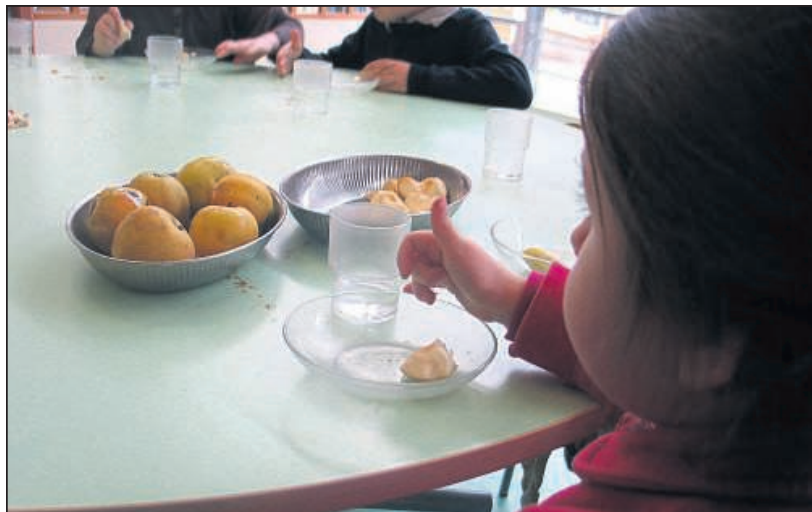
BOULOGNE-BILLANCOURT, ÉCOLE SÈVRES, HIER. Les 26 écoles primaires de la ville proposent désormais un repas entièrement bio tous les mois.