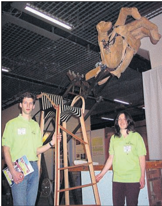
LA DÉFENSE, HIER. La quatrième édition du salon TopMétier'92, qui s'est ouverte hier au Cnit, est une bonne occasion de découvrir des centaines de métiers, dont les métiers d'art peu connus des ados. Ici, les œuvres géantes d'anciens élèves de l'école Boulle.

■ Isabelle ouvre l'Europe aux plus jeunes. Vous êtes élu au conseil municipal des jeunes de votre ville et vous avez envie de parler de vos projets et de votre vie avec des collégiens d'un autre pays ? C'est possible ! Enseignants, parents, élèves, peu le savent, mais la Com-