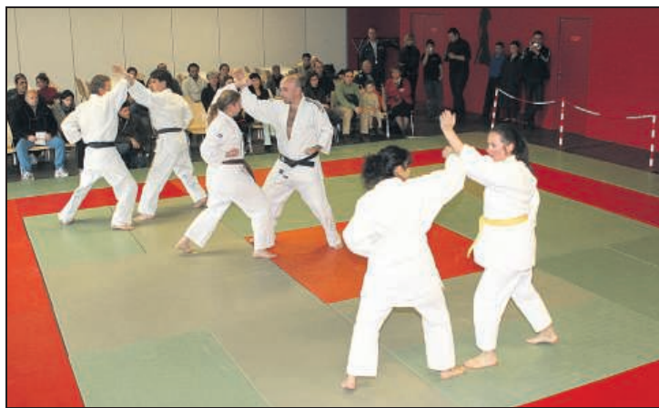
CLAMART. La ville organise des stages de self-défense à l'occasion de la Journée de la femme.