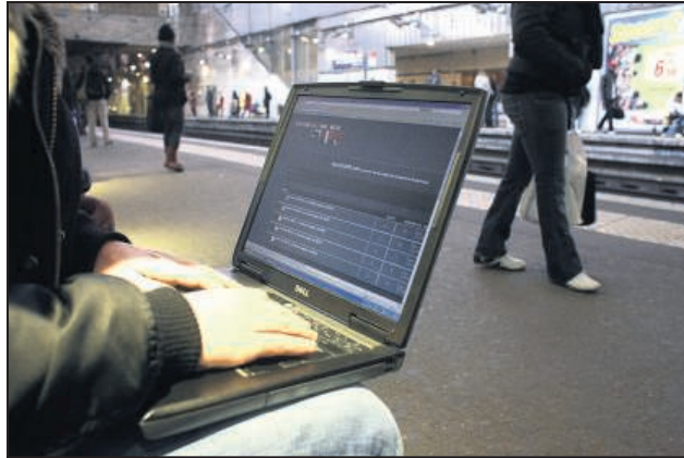
EVERY-COURCOURONNES, GARE DU RER D, HIER. Marredurer.com se veut aussi un site internet constructif où les usagers proposent des solutions et des idées.