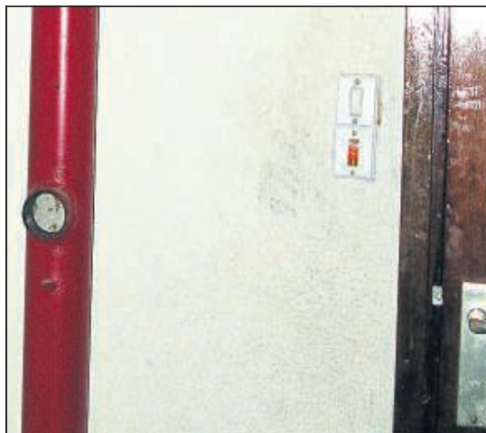
EPINAY, LE 16 DECEMBRE 2008. Lors de l'incendie d'une tour qui avait fait un mort, l'intervention des pompiers avait été perturbée par l'absence de robinets sur la colonne sèche : ils avaient été sciés.